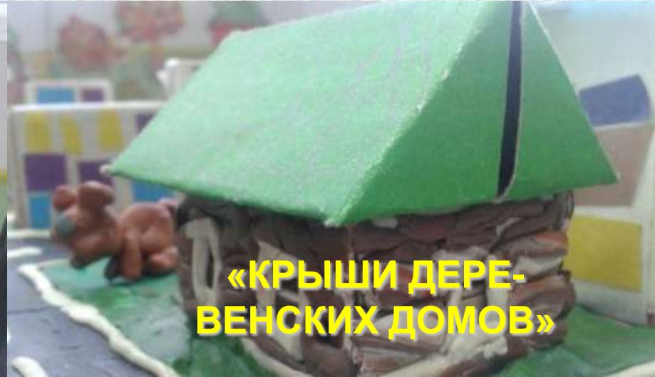
«КРЫШИ ДЕРЕВЕНСКИХ ДОМОВ»