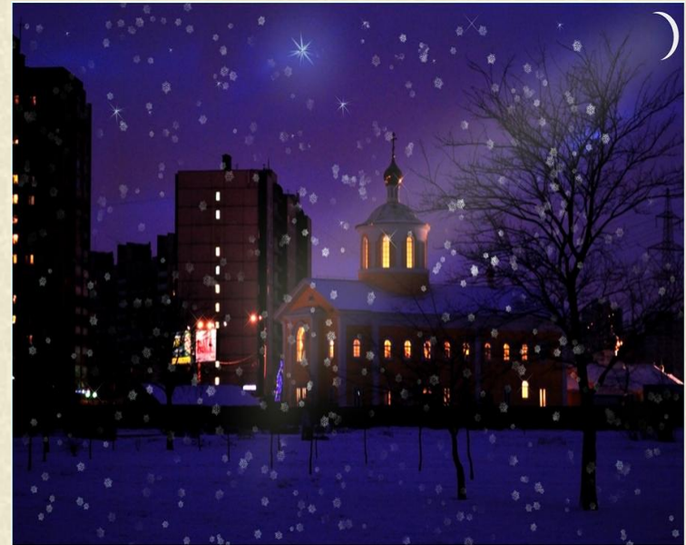
Санкт - Петербург «Ночь перед Рождеством»