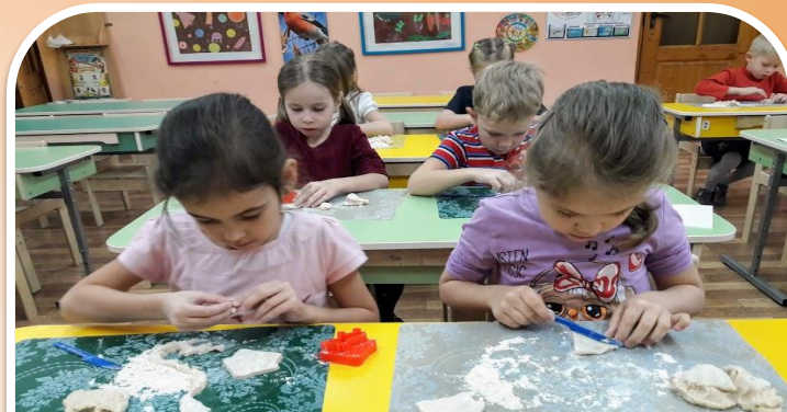
Знакомство с солёным тестом, сеанс лепки «Живое тесто»