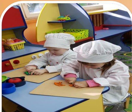
Сюжетно-ролевая игра «Мы кулинары»